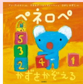
Penelope by Anne Gutman and Georg Hallensleben © Gallimard Jeunesse Licensed by Nippon Animation Co., Ltd.

Anne Gutman(アン・グットマン)、Georg Hallensleben(ゲオルグ・ハレンスレーベン)夫妻によるフランスの絵本シリーズ「Pénélope(ペネロペ)」が原作。日本では2004年に岩崎書店より日本語版絵本の出版が開始され、2013年に原作絵本誕生10周年を迎えました。2006年には、3DCGアニメーション「うっかりペネロペ」としてNHK教育テレビ(現在のEテレ)にて第1シリーズの放送を開始。その後、同局にて毎年再放送があり、現在は第3シリーズを再放送中です。